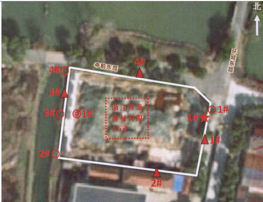
图 6-1 采样点位图